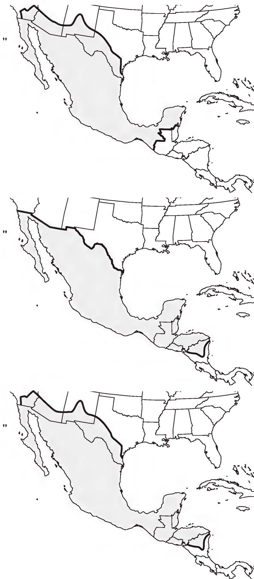
Fig. 2. Megaméxico. De arriba hacia abajo: Megaméxico 1, Megaméxico 2 y Megaméxico 3, de acuerdo con el trabajo de Rzedowski (1991a).